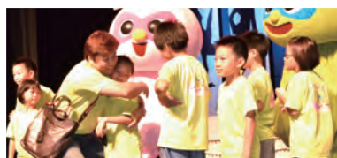
陪伴失親兒擔任失親兒一日爸媽