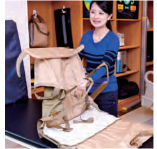
▲移轉位滑墊／滑墊上的諸多把手都是配合搬運移位過程而設計，方便照顧者施力。