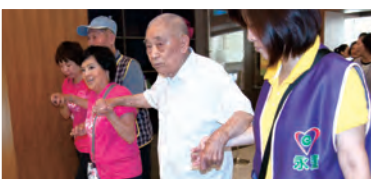
協助身障朋友聆聽音樂饗宴