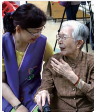
♥與長者們貼心的談天與按摩。

永達志工首發團 探訪淡水「 仁濟安老所」 四月二十六日，永達志工來到 「仁濟安老所」銀髮安養機構，包 含永達三十五位志工與協會十五位 志工，陪伴四十位長者。這群沒有 經驗的永達志工，難以掩飾心中的 興奮與緊張，小心翼翼的攙扶著長 輩們，以貼心的問候與親切的笑容 ，化解了陌生的距離感。