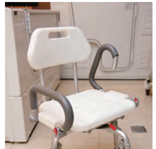
▲洗澡椅／把手可掀起、椅面可旋轉，降低照顧者為患者洗澡的難度。

於八十公分、以坡度取代門檻等等；若以安全為考量的話，則應在家中容易跌倒的地方安裝扶手，並在浴室加裝防滑設備等等。