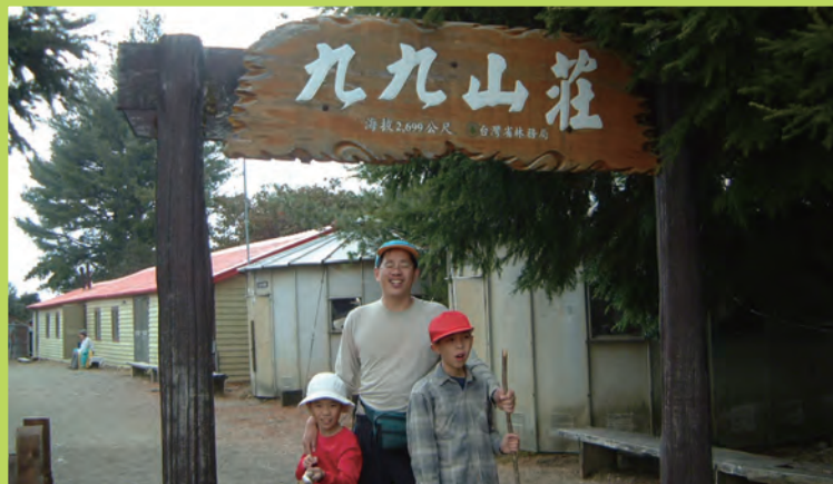
劉克襄帶兩個小孩爬大霸尖山之紀念合影。

孩子到戶外接近大自然，帶著他們探訪台灣的農村、小鎮、老街，坐火車旅行、賞鳥等等，他說：「我希望能讓孩子們了解自然生態的價值，將自己喜歡的東西帶到小孩子的生活當中，這是一種生活信仰與價值的傳承。」旅行途中，他總會要求兩個小孩帶上畫具，隨時隨地找機會佇足、觀察、描繪，帶他們領略以繪畫書寫旅遊記憶的樂趣。