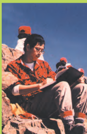
劉克襄年輕時登玉山照片。

炎炎的夏日、長長的暑假，來不及安排出國旅遊的父母，不妨就近安排國內親子旅遊，依據劉克襄的推薦與建議，帶小孩到戶外走走看看，也藉機增進親子之間的互動與了解。