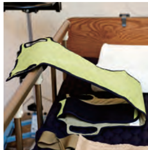
▲翻身帶／讓照顧者為患者翻身拍背時，無需一直用手抱著患者，避免肌肉長時間用力。