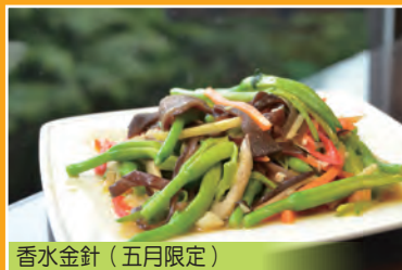
香水金針 (五月限定)