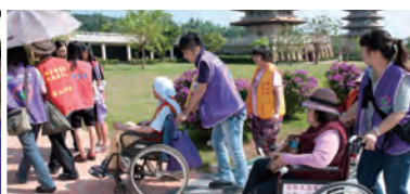
陪伴長者暢遊佛陀紀念館