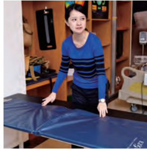
▲移位滑板／患者躺在板上，透過滾動的原理，輕鬆移位。