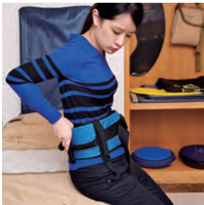
▲移位腰帶／綁在被照顧者身上，前後左右側把手方便照顧者施力搬運，扣在輪椅上又可當成安全帶。