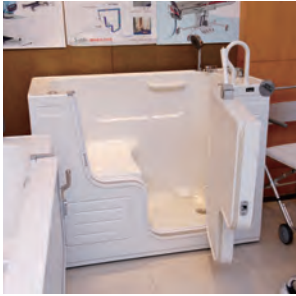
▲開門式浴缸／方便行動不便者可自行移位洗澡。