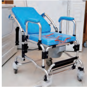
▲洗頭洗澡椅／可當便器、洗澡椅，椅背又可放下方便洗頭，多功能的浴廁用椅。