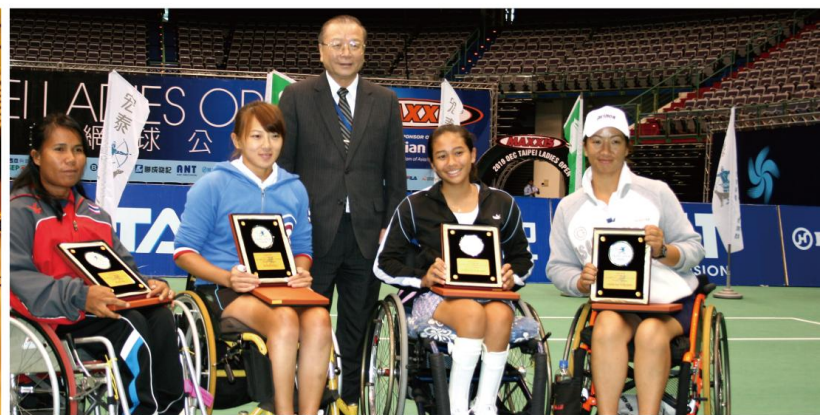
▲2010永達宏泰盃女子雙打冠亞軍合影