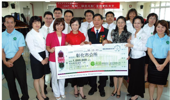
▲永達贊助彰化市公所舉辦「少年磐石專案」100萬元。

慈生仁愛院院生永遠面帶笑容，熱忱與人互動，雖然他們在智力上有中度、重度、極重度等多重障礙，但他們樂觀、開朗的笑容，永遠以最熱情的音量說：「老師好」、「老師我愛你」，真誠的笑聲、歌聲在師生之間流轉，彰化市立管絃樂團的老師們得到了最寶貴的禮物——『生命中有愛與喜樂伴隨，是何其的美好』。