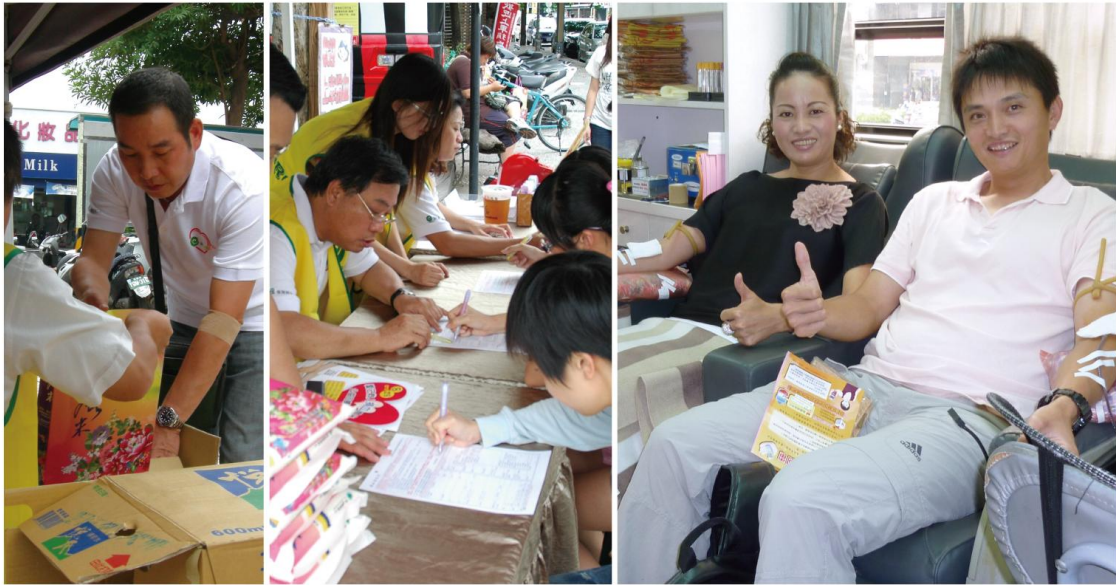
▲永達同仁擔任捐血志工，號召民眾響應捐血活動。