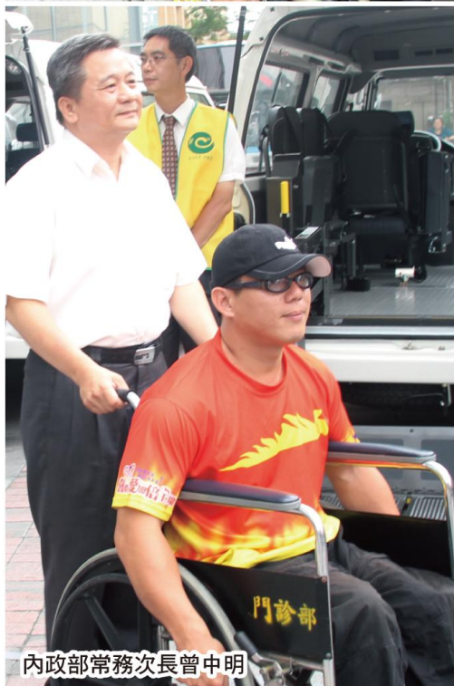
內政部常務次長曾中明