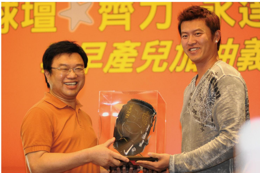
▲王建民親筆簽名手套由永達吳文永董事長高價得標。

巴掌仙子一出生就會面臨人生的困境和挑戰，Yuki媽媽三年內分別產下28週(1084公克)及26週(830公克)的早產兒寶寶，面對孩子的急救及治療過程，多次讓Yuki媽媽失去信心，幸運的是在早產兒醫療團隊用心的照護及早產兒基金會的居家服務、追蹤服務協助下，讓他們沒錯過黃金早期治療時期，而能順利健康成長。