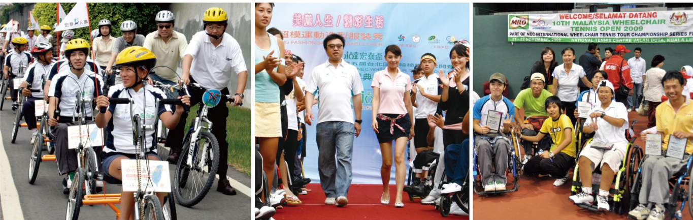
▲ 咖啡車環台計劃(圖左)、超模運動服裝秀(圖中)、馬來西亞公開賽(圖右) 開啟身障朋友新視野。