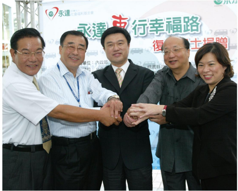
▲2008年復康巴士捐贈儀式(左一:澎湖王乾發縣長 左二:前內政部廖了以部長 左三:永達吳文永董事長 左四:台中胡志強市長 左五:嘉義黃敏惠市長)