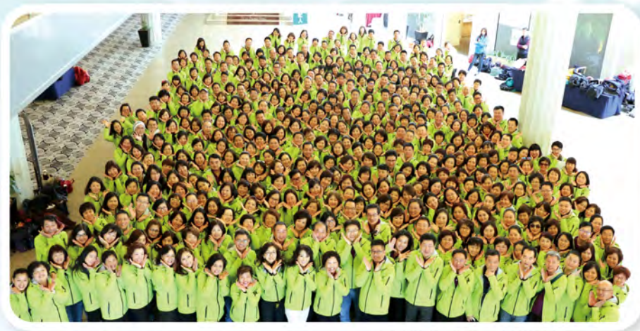
▲ 2016年上半年高手交流會處主管及MDRT高手於日本舉行，共228人參加。

這些優秀的MDRT甚至是終身會員不僅行銷、經營組織出色，透過經驗分享，強化競爭優勢，藉由學習及複製成功經驗，讓更多業務菁英加入「保險企業家」的行列。