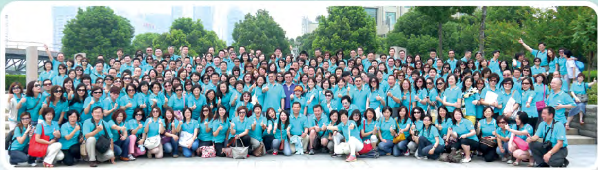
▲ 2012年下半年高手交流會處主管及MDRT高手於上海舉行，共281人參加。