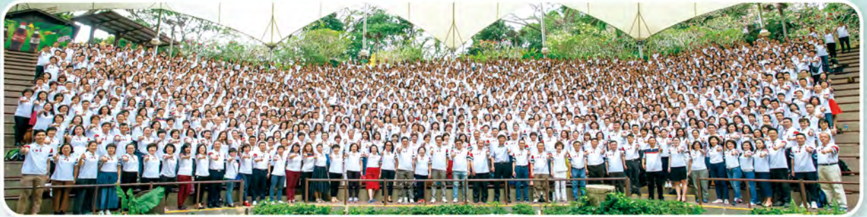
▲ 2018年上半年兩岸高手交流會處主管及MDRT高手於新加坡舉行，共1,312人參加。