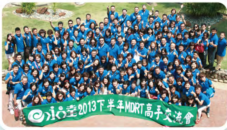
▲ 2013年下半年MDRT高手交流會於馬來西亞舉行，共154人參加。