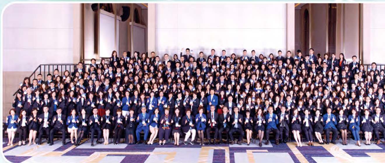
▲ 2021MDRT DAY TAIWAN國際學習日參加人員319位。

永達保經重視人才，延續向高手請益的精神，2021年即使疫情險峻，仍舉行兩次「高手交流會」，鼓勵業代參與MDRT DAY學習，因為追求卓越不能停下腳步，面對疫情，更要加倍努力，才能在躍起的時候比別人跳得更高、更遠。