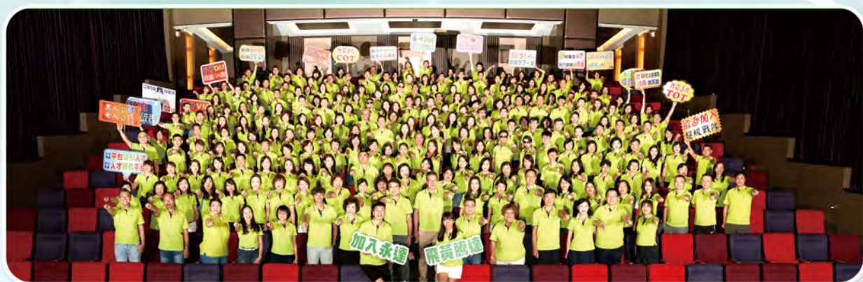
▲ 2020年下半年高手交流會於花東舉行，共296人參加。

永達保經重視人才，延續向高手請益的精神，2021年即使疫情險峻，仍舉行兩次「高手交流會」，鼓勵業代參與MDRT DAY學習，因為追求卓越不能停下腳步，面對疫情，更要加倍努力，才能在躍起的時候比別人跳得更高、更遠。