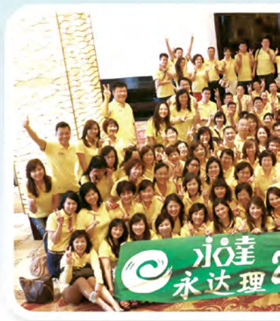
▲ 2014年下半年高手交流會處主管及MDRT高手於日本舉行，共228人參加。