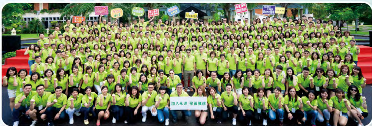
▲ 2020年上半年永達高手交流會處主管及MDRT高手於峇里島舉行，共287人參加。

這些優秀的MDRT甚至是終身會員不僅行銷、經營組織出色，透過經驗分享，強化競爭優勢，藉由學習及複製成功經驗，讓更多業務菁英加入「保險企業家」的行列。