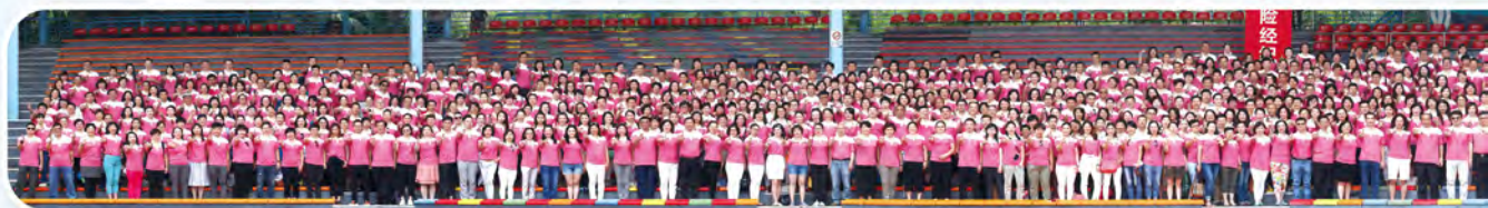
▲ 2017年兩岸下半年高手交流會處主管及MDRT高手於泰國舉行，共1,004人參加。