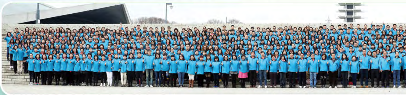
▲ 2019年上半年兩岸高手交流會處主管及MDRT高手於日本舉行，共872人參加。