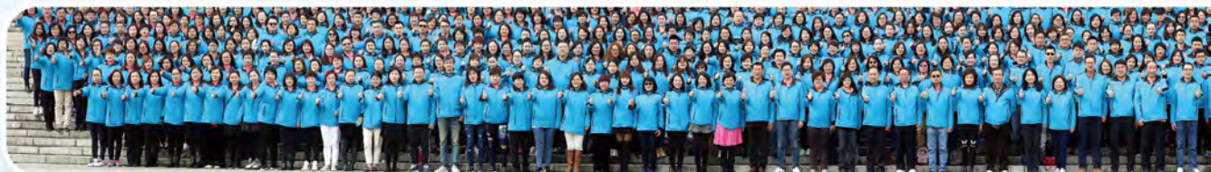
▲ 2017年兩岸上半年高手交流會處主管及MDRT高手於澳門舉行，共957人參加。