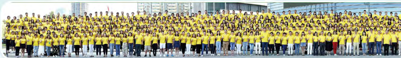
▲ 2018年下半年兩岸高手交流會處主管及MDRT高手於西安舉行，共839人參加。

這些優秀的MDRT甚至是終身會員不僅行銷、經營組織出色，透過經驗分享，強化競爭優勢，藉由學習及複製成功經驗，讓更多業務菁英加入「保險企業家」的行列。