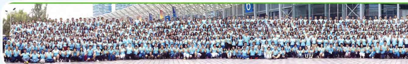
▲ 2019年下半年兩岸高手交流會處主管及MDRT高手於成都舉行，共1,369人參加。