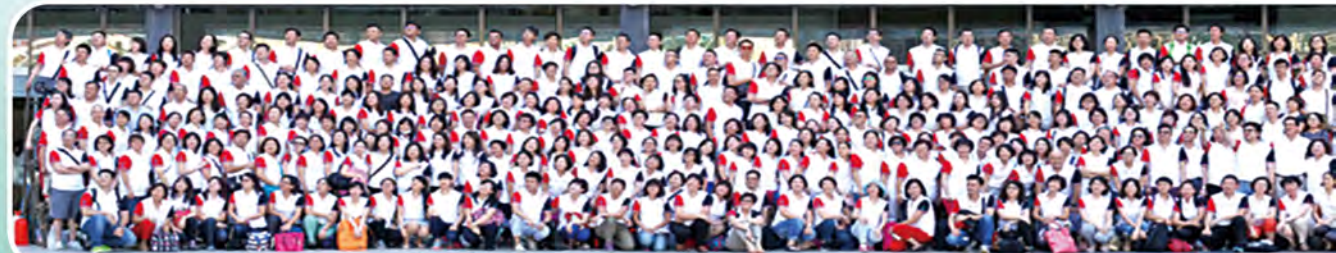
▲ 2016年下半年處經理策劃會報暨兩岸高手交流會及MDRT高手於長江三峽舉行，共720人參加。