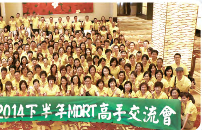
及MDRT高手於上海舉行，共247人參加。