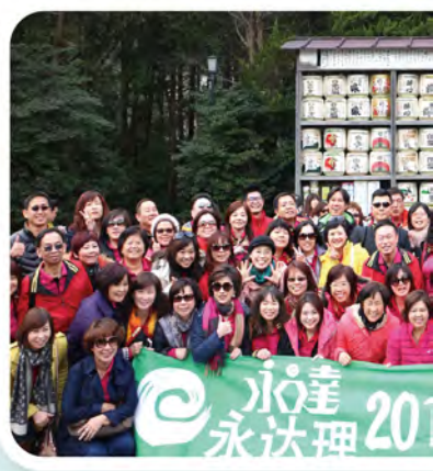
▲ 2015年上半年高手交流會處主管及MDRT高手於日本舉行，共228人參加。