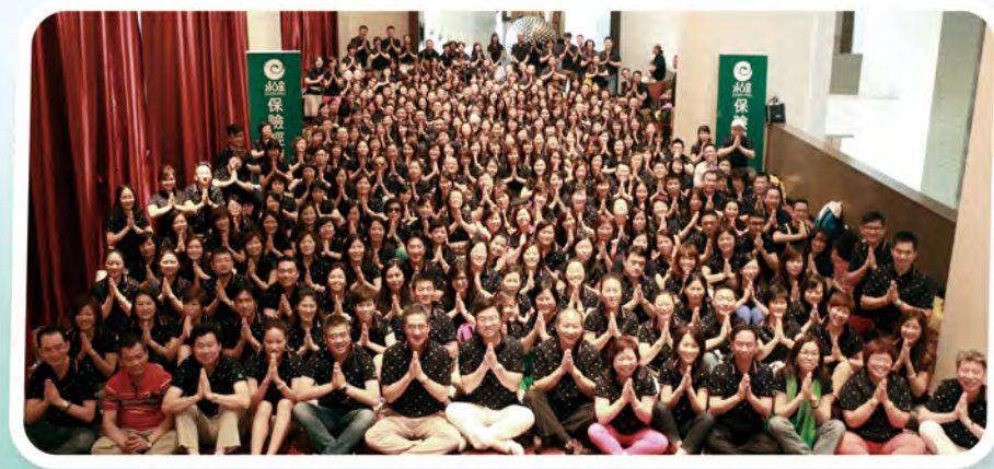
▲ 2015年下半年高手交流會處主管及MDRT高手於泰國舉行，共216人參加。