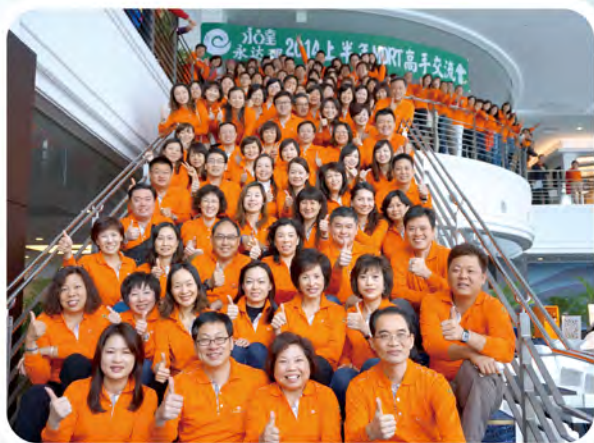
▲ 2014年上半年高手交流會處主管及MDRT高手於日本舉行，共200人參加。