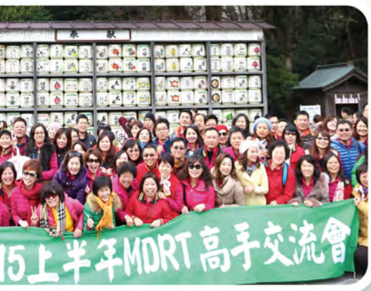
及MDRT高手於日本舉行，共195人參加。