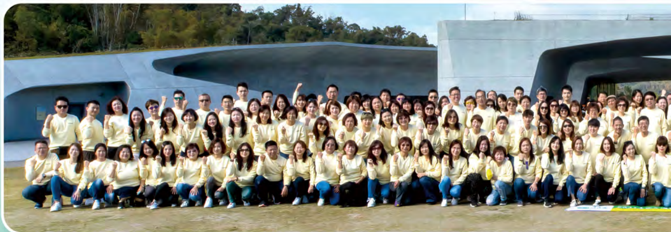
▲ 2021年上半年高手交流會於日月潭舉行，共200人參加。