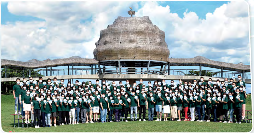
▲ 2021年下半年高手交流會於台東舉行，共129人參加。