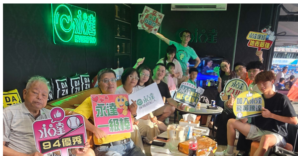
北一團隊老、中、青三代貴賓齊聚同樂永達滿貫VIP包廂。