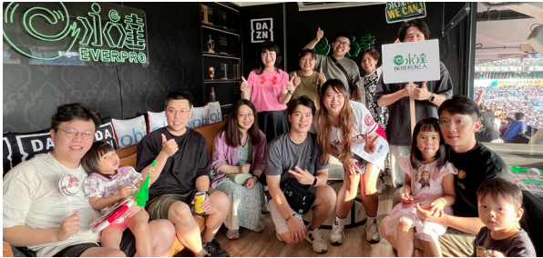
世傑團隊不遠千里從高雄偕同貴賓到桃園觀棒球隊賽。