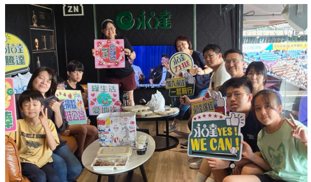
來自台中的麗英團隊貴賓，活力滿載為賽事加油。