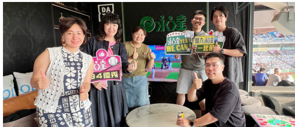
一群喜歡棒球的永達熱血夥伴。