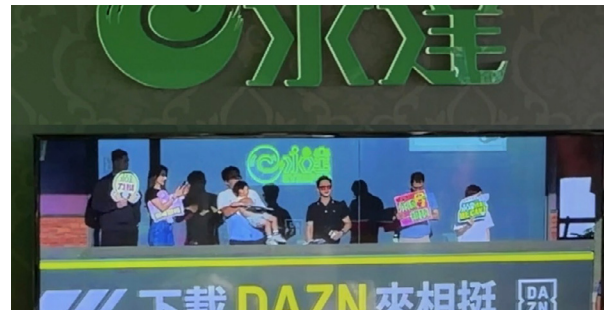
熱情應援吸睛登場，轉播畫面留下精彩身影。

用專業態度，陪伴客戶人生中每場精彩時刻，永達保經麗英團隊令鈞處邀請貴賓客戶自高雄北上，齊聚「永達滿貫VIP」主題包廂，共享結合專業服務與尊榮款待的頂級觀賽體驗。