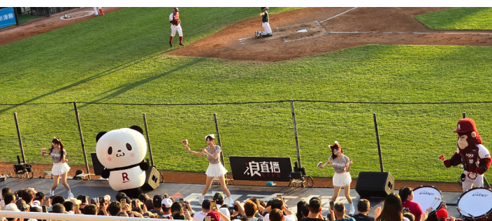
樂天女孩與吉祥物熱情演出。

永達始終相信，保險服務不僅是提供保障，更是長期陪伴與關懷的展現。透過滿貫VIP系列活動，希望讓客戶在享有專業服務之餘，也能感受到永達對每一位保戶的重視與用心。未來，永達也將持續規劃多元且優質的活動，與保戶一同分享生活中的美好時刻。