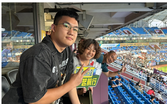
永達貴賓來到包廂的戶外座位區感受遼闊視野。