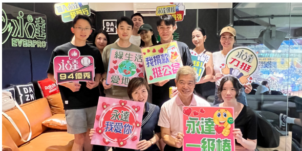
明堂團隊邀請貴賓在最尊榮包廂熱血觀賽。

5月22日的週五夜，明堂團隊於「永達滿貫VIP」包廂舉辦專屬觀賽活動！當晚樂天桃猿對陣富邦悍將，一開場就有精彩安打引爆全場熱血。令人眼睛一亮的是，席間迎來了多位年輕活潑的帥哥美女客戶與新秀，不僅讓包廂氣氛嗨到最高點，更展現了永達客群持續年輕化的嶄新趨勢。