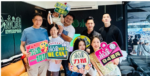
麗英團隊令鈞處業務主管及貴賓跨越300公里齊聚球場，共創熱血滿貫應援回憶。