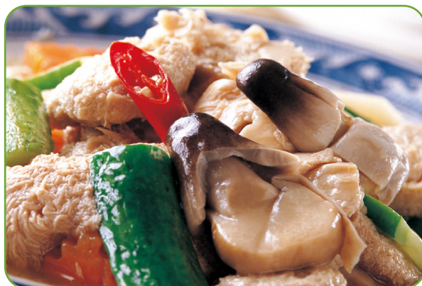
常被忽略的大腸癌危險因子——隔夜菜。