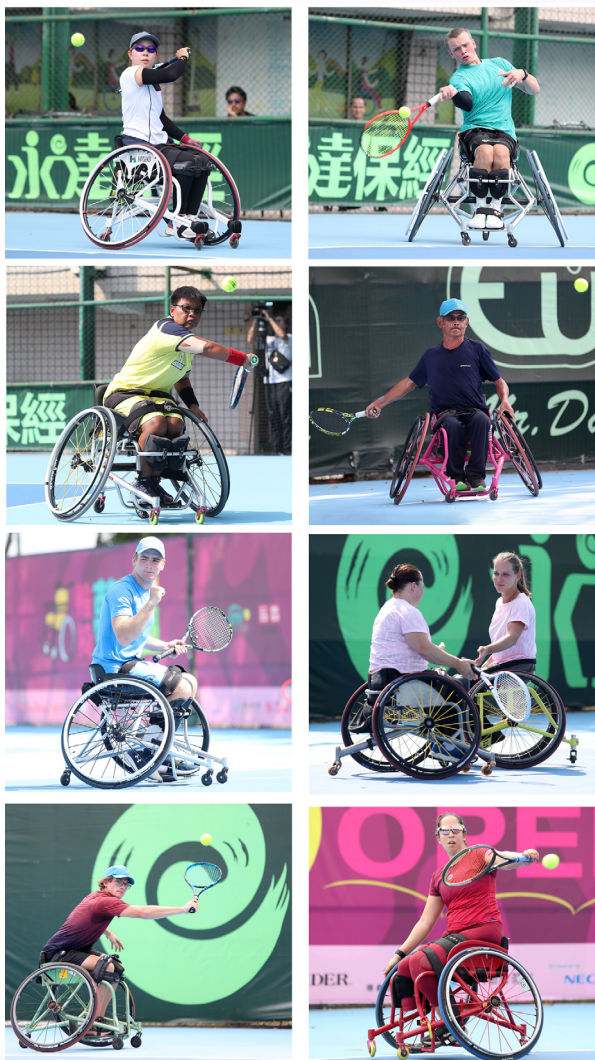
來自國內外征戰世界賽事的好手們齊聚高雄，互相切磋球技。