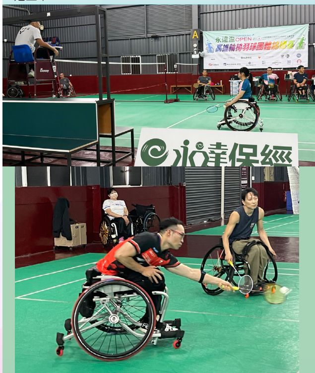
輪椅羽球團體錦標賽進入第五屆的賽事，展現強大團隊凝聚力。

事，更以全方位的行動支持輪椅網球發展，從基層訓練班的培育、競賽與相關器材贊助…等。並長期關注身心障礙者的運動平權與社會參與權益，透過不間斷的投入，運動推廣項目從輪椅網球、輪椅壘球等陸上運動，到獨木舟、SUP 等海上挑戰。