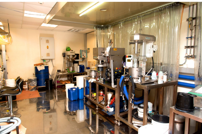
耗資 8 千萬元建立測試中心。

每年的尾聲，他都會進行年度總回顧，檢視今年、展望明年，電動車的市場及碳權的議題，讓他樂觀看待未來商機，奈米化技術有助提高產量、降低時間，藉此減少碳排放。陳仁英如同倒吃甘蔗的人生故事，是年輕人的最佳典範，從零開始、白手起家，沒有不可能、只有要不要！