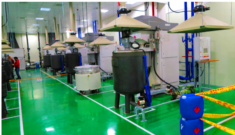
提供從研發實驗工廠到正式量產的整廠規劃及諮詢服務。