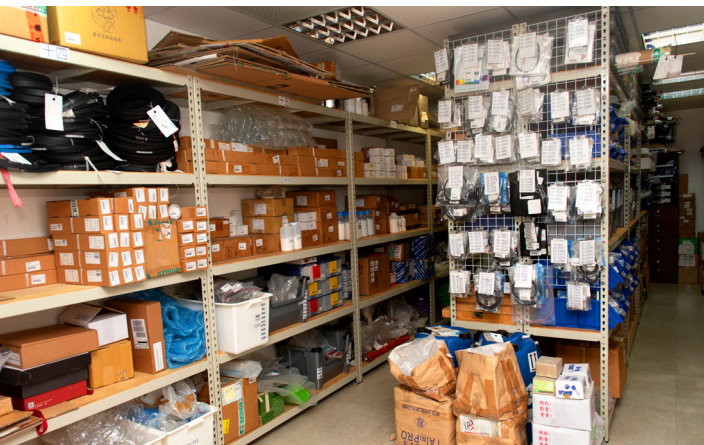
設備元件儲藏室擁有多達 3900 項零件。

熱愛讀書自學的陳仁英，看書速度非常快，雖然念的是理工，但因為立志從商，閱讀了許多商科書籍，甚至還是就讀國貿科系太太的小老師。畢業後就業，陳仁英依照信奉的神明－媽祖的指示，在一家鑄造廠從事業務工作，滿懷雄心壯志的他，上班的第一天就調出全台鑄造廠的資料，每一家都親自拜訪、認真觀察、製作筆記，從製程中發掘自家商品的切入點，讓客戶明白透過他們公司的產品，將會創造的巨大優勢與利益，只要花一百多萬，每年就能增加一千多萬的績效，幾乎所有接洽的廠商都成交，也讓他在工作第一年就創下年薪百萬的業務佳績，過程中更熱心地為合作廠商撰寫了 7 本鑄造手冊。