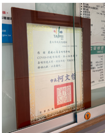
COVID-19 疫情期間為信義區防疫核心醫院，接受表揚。

疾病一直復發，久而久之就會演變成慢性疾病。有一次看診，因為感冒頭痛欲裂，結果醫師簡單檢查一下鼻子，就叫我去蒸鼻子，其實當時我真的非常不舒服，這次的看診經驗，讓我發誓，以後絕對不當這樣的醫師！」