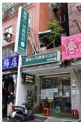
嚴敏心耳鼻喉科位於信義區松山路。

庭醫師整合性照護計畫」，她表示：「我希望我們診所能夠成為社區民衆的家庭醫師，透過成人健康檢查、疫苗注射等相關的衛生保健服務，協助民衆追蹤自身健康情況；同時也希望未來能有更多專科醫師加入，提供更完整、多元化的醫療服務，就像聯合門診的模式，快速協助患者解決醫療上的問題，讓患者不用為了疾病奔波。而且，新醫師的加入，也能帶入新觀念與新技術，有助診所與時俱進，大家互相切磋、學習進步，提供患者更好、更先進、更完整的醫療服務。」