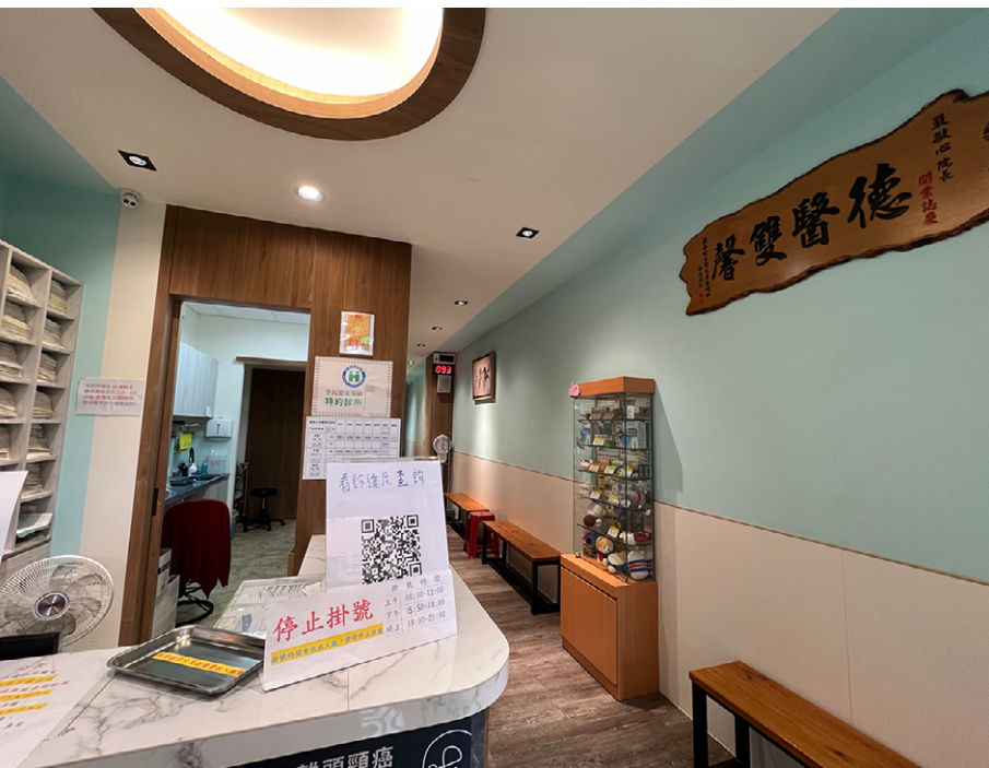
診所空間小巧而明亮。