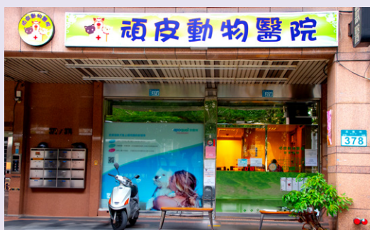
台大頑皮動物醫院座落在三重區溪尾街上。

大環境拔河，就是因為看見動物就醫模式單一化背後的問題，希望能在動物醫療上略盡自己的棉薄之力。