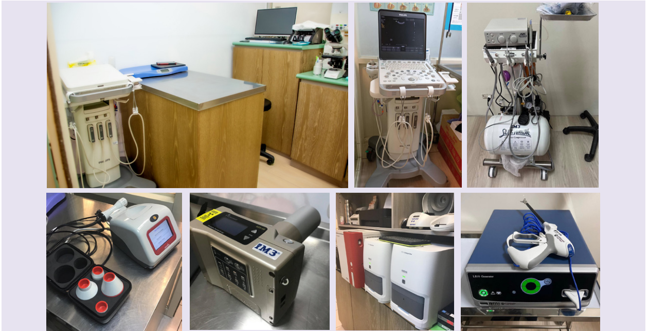
台大頑皮動物醫院重視檢測，引進最先進的儀器設備。