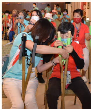
▲ 細心的志工為長輩解開健走杖的繫繩。