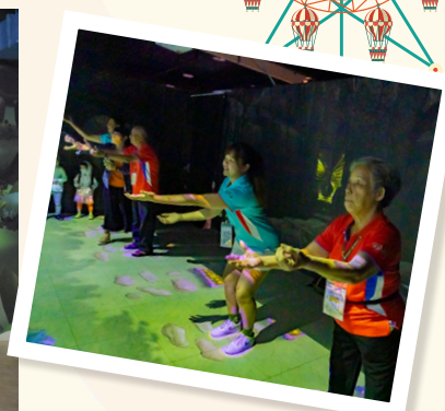
▲ 永達志工陪伴弘道長輩體驗適合親子同樂的天神試煉戰。

由永達社會福利基金會主辦、高雄義大樂園協辦、永達保險經紀人贊助「花甲少年去七淘」長者出遊活動，於9月9日舉辦南區場次，帶弱勢長輩出遊，邀請高雄地區弘道老人福利基金會服務的弱勢長者，透過樂園活動讓許久沒出門七淘的長者與永達志工一起來到義大樂園重返18歲