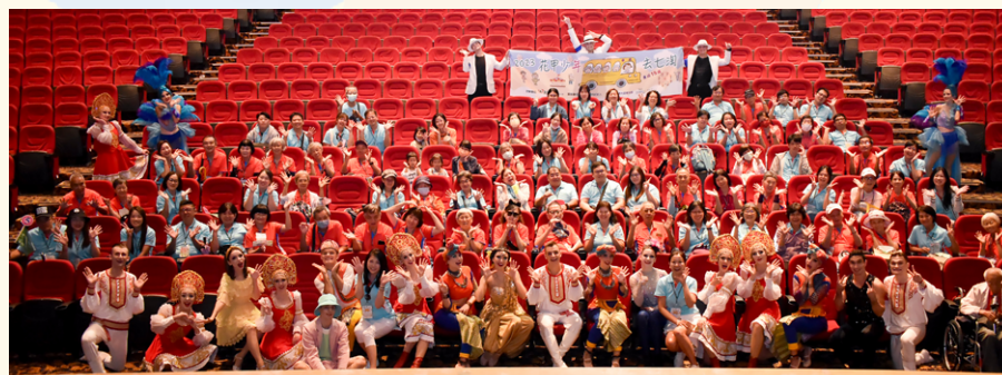
▲義大樂園皇家劇院演員演出後，來到台前與志工及長輩們一起合影。