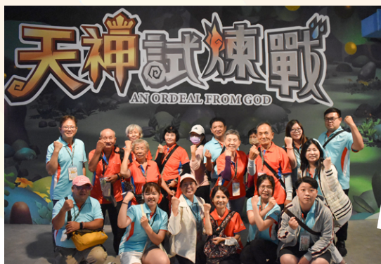
▲ 熱情的志工和長輩一起體驗樂園設施，長輩們重返年輕記憶。