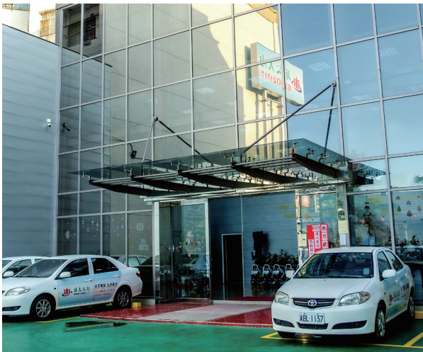
2020年，菲太企業全新辦公大樓落成，大樓前方寬敞的停車空間，方便務洽談與接送。