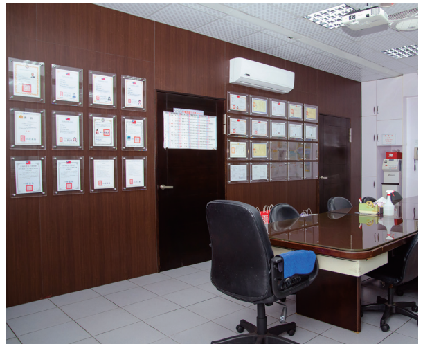
會議室牆上有著密密麻麻的證書，展現菲太的專業。