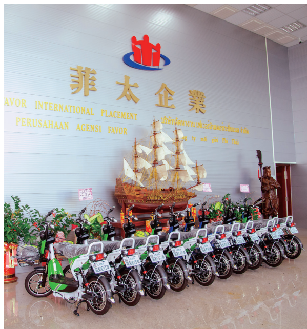
引進電動機車，並輔導申請，滿足移工交通方面的需求。