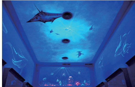
隱形壁畫／經過燈光照射，原本純白的牆面，瞬間蛻變為海洋世界。