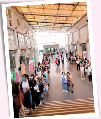
▲民眾秩序井然的排隊準備進場。

演唱會上半場由向娃、曾治豪主持，兩代之間具有傳承的意義，節目由陳孟賢、陳昭璋兄弟揭開序幕，兩人唱作俱佳，將熟知的「為了十萬元」以詼諧方式呈現，贏得滿堂彩。新生代軍中女神李宣榕以清新之姿與現場觀眾互動，擺動手機燈光一片燈海，氣氛浪漫；軍中情人方季惟表演經典歌曲----願蒼天變了心，走下台不少民眾爭相與她握手，玉女風采不減當年，歌聲撫慰了所有人的心；重量級嘉賓陳亞蘭領軍，帶著歌仔戲團隊一起帶給觀眾傳統與創新的演出，勾起所有人心中的回憶！金曲歌后曹雅雯，以溫柔又暖心的歌曲，帶來滿滿感動。