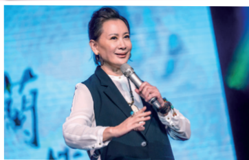
▲陳亞蘭帶著歌仔戲團隊帶來傳統與創新的演出。