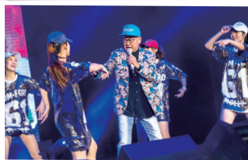
▲嘻哈始祖劉福助，在台上盡情飆歌。