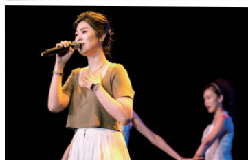
▲金曲歌后曹雅雯，溫柔又暖心的歌聲帶來滿滿感動。