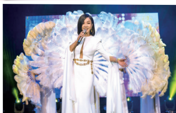
▲「台灣尚水」歐巴桑陳美鳳，帶來經典歌曲『一代佳人』。

居長者走出來、並為身心障礙朋友帶來正面力量，即使在疫情之下，能看到許多長者及身心障礙朋友於觀賞表演時開懷的笑、滿足的拍手，看著自己喜愛的歌星唱出記憶中經典歌曲回想起陳年往事，就是永達長年贊助此演唱會感到最富意義的一刻，期藉由藝人力量，喚起社會對弱勢的重視，並用愛和耐心陪伴他們走過人生道路。❤