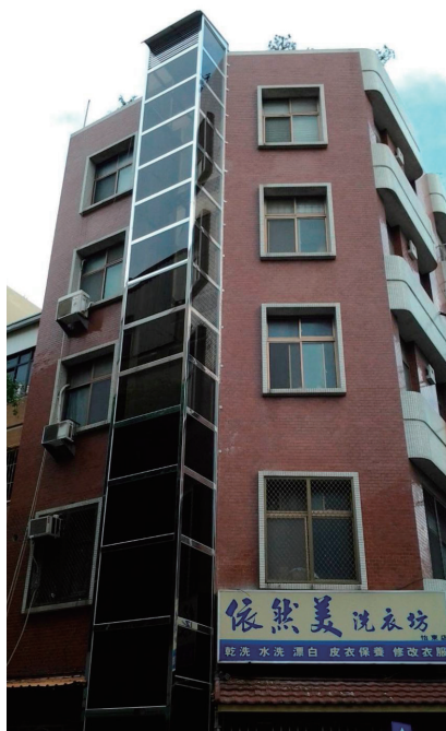
透天外掛施工案例