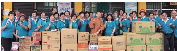
參與賑災活動助弱勢。