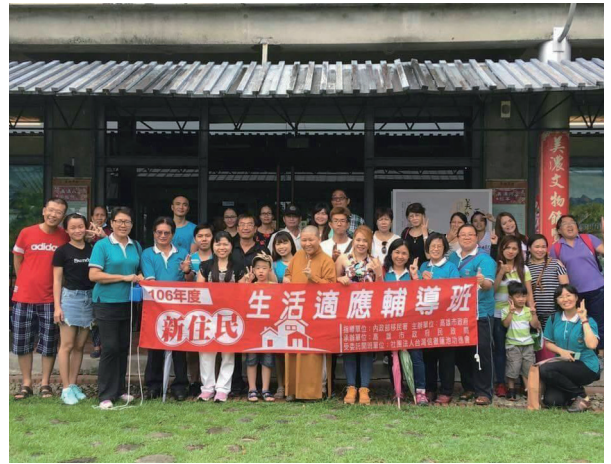
新住民姐妹家庭生活適應輔導班。

心中掛記信徹禪寺，於是回覆證嚴法師，她的佛緣在信徹禪寺，就在 23 歲那年，回到信徹禪寺正式出家。