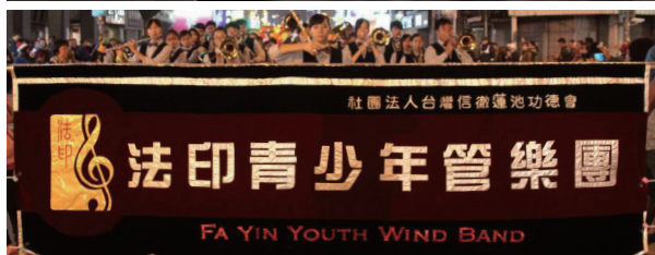
法印青少年管樂團帶給許多孩子自信與希望。