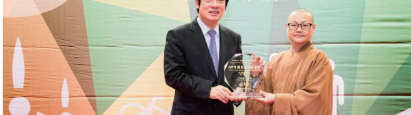
社團法人台灣信德蓮池功德會獲頒2018年國家永續發展獎。