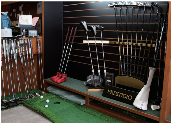
永安高爾夫用品社講究有溫度的服務，未來預計在店內闢試打區。