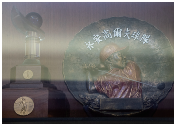
永安高爾夫球隊是當初成立永安高爾夫球場的第一個球隊。